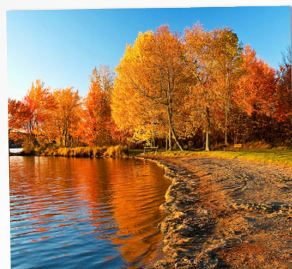
PROGRAMMA DI SETTEMBRE