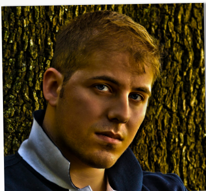
LETTERA DEL PRESIDENTE

And a big dark cloud took away our dearones, what will they have thought about before leaving? There's someone who says that he saw the devil's face. But this is not important, they took the road, the no-return road.