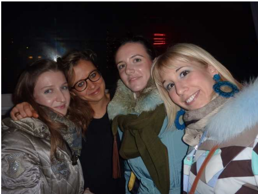
Aperitivo degli auguri del Rotaract Ferrara