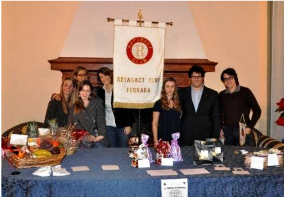
2 Torneo di Burraco del Rotaract Ferrara