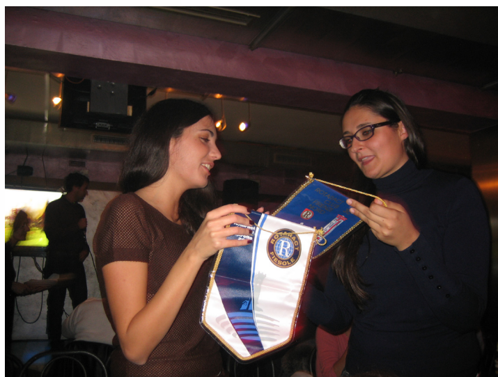
Scambio di gagliardetti durante l'Interclub di karaoke al kiwi con il Club Firenze Nord