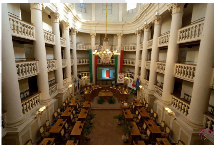
Magnifica Sala del Tricolore dove si è svolta la III Assemblée Distrettuale