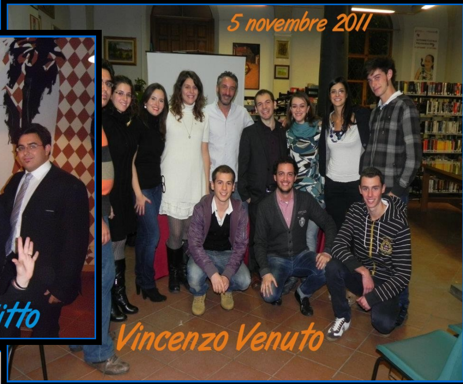
5 novembre 2011