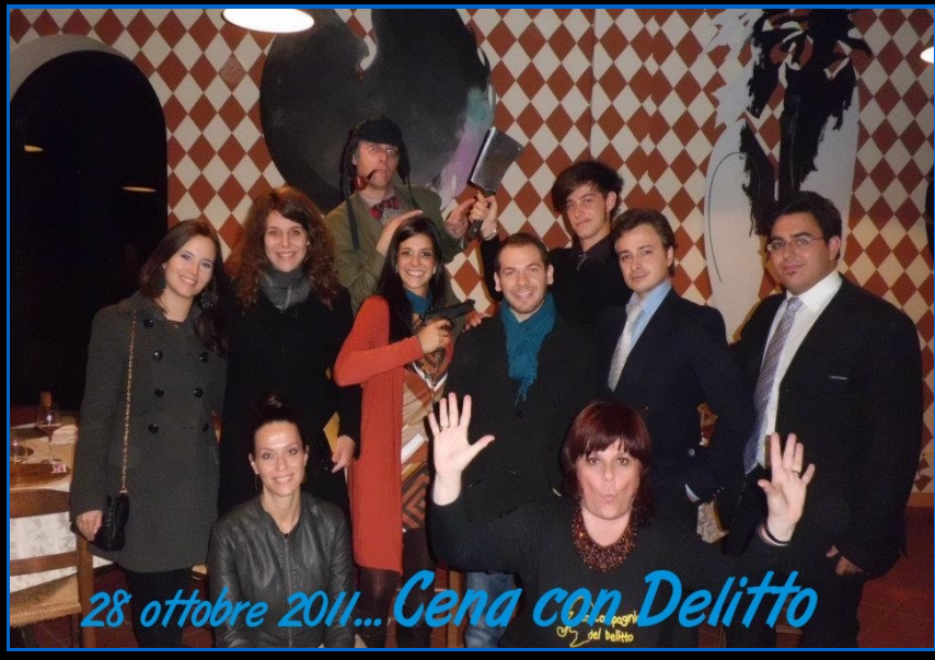
28 ottobre 2011... Cena con Delitto