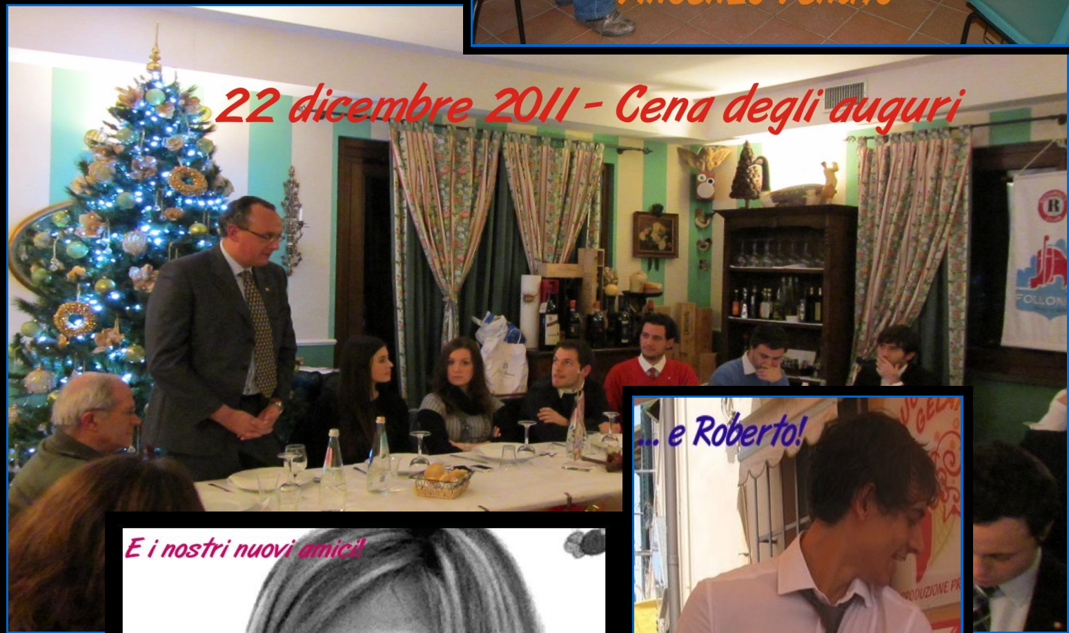
22 dicembre 2011 - Cena degli auguri