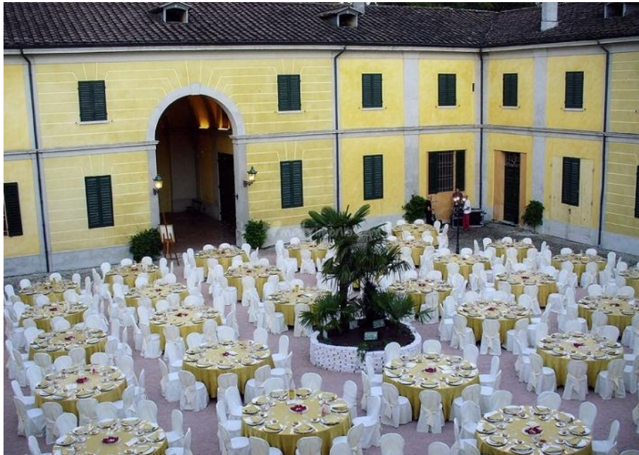
Corte Spalletti – Rubiera RE – location per Cena & Festa