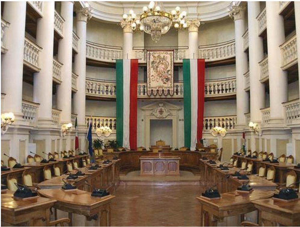
Sala del Tricolore – Reggio Emilia – sede dei lavori

Dalla Mattina – Arrivi, Check In e registrazione dei Partecipanti