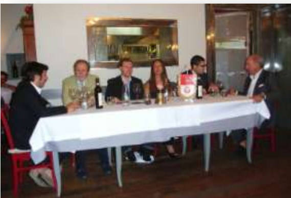
FOTO DEL PASSAGGIO DELLE CONSEGNE