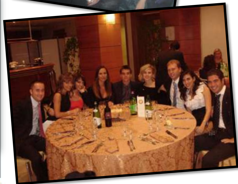
Conviviale con Marcello Lippi ex CT Nazionale Campione del Mondo