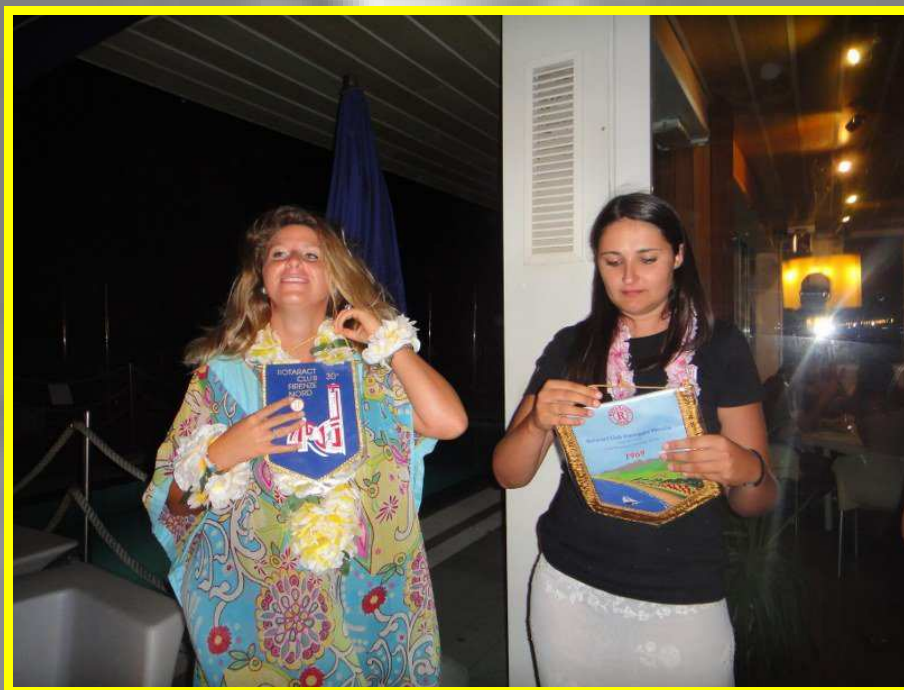
HAWAIIAN BEACH PARTY @ B2K Gemellaggio fra Viareggio Versilia e Firenze Nord 29/7/2011